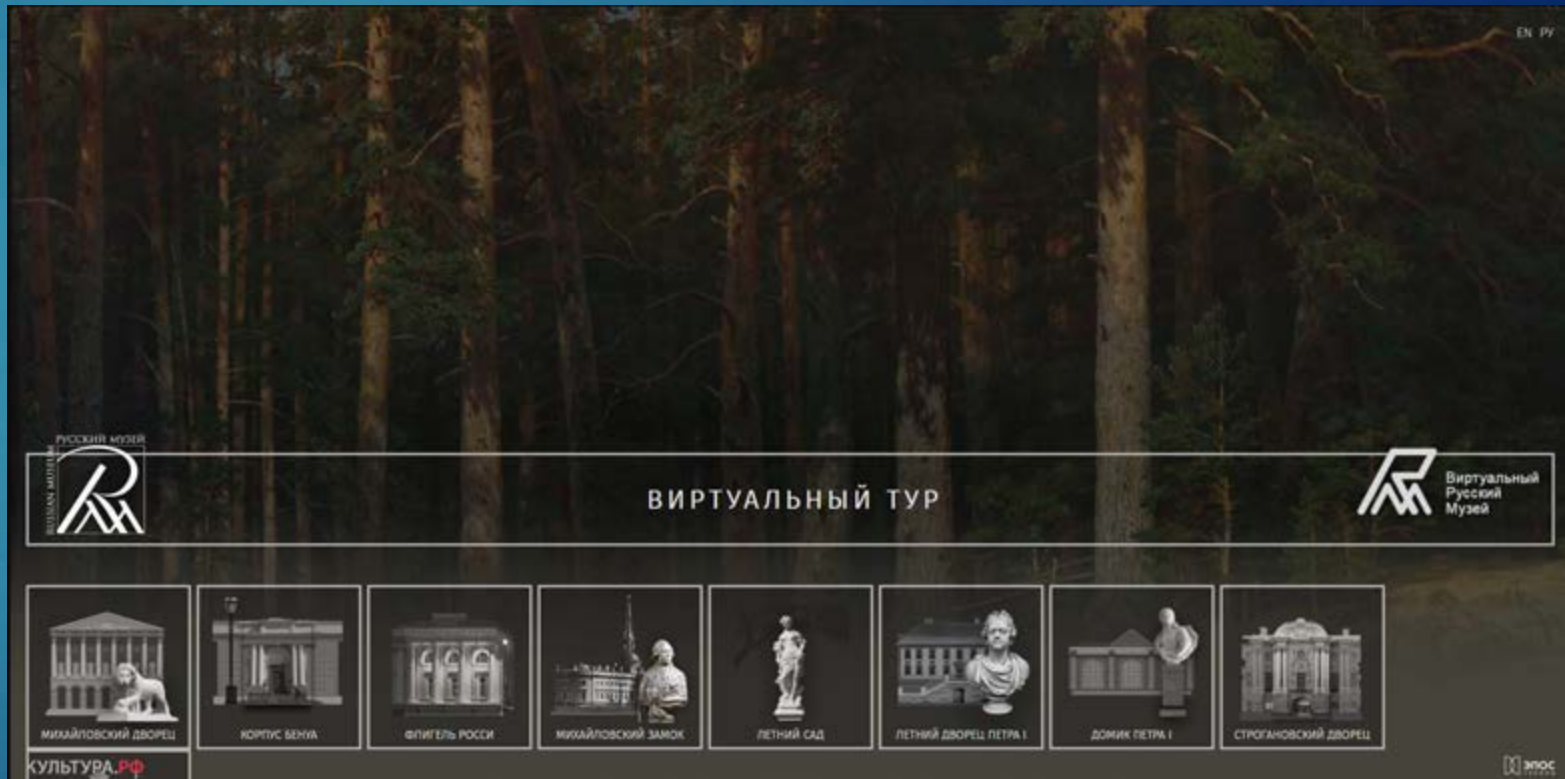
Виртуальные туры. Культура РФ